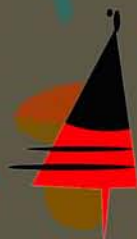
Asociación de Amas de Casa "Doña Sancha"