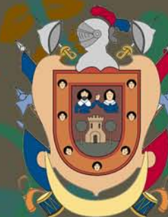
Excmo. Ayuntamiento de Salas de los Infantes