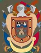
Excmo. Ayuntamiento de Salas de los Infantes