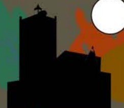
Parroquia de Salas de los Infantes