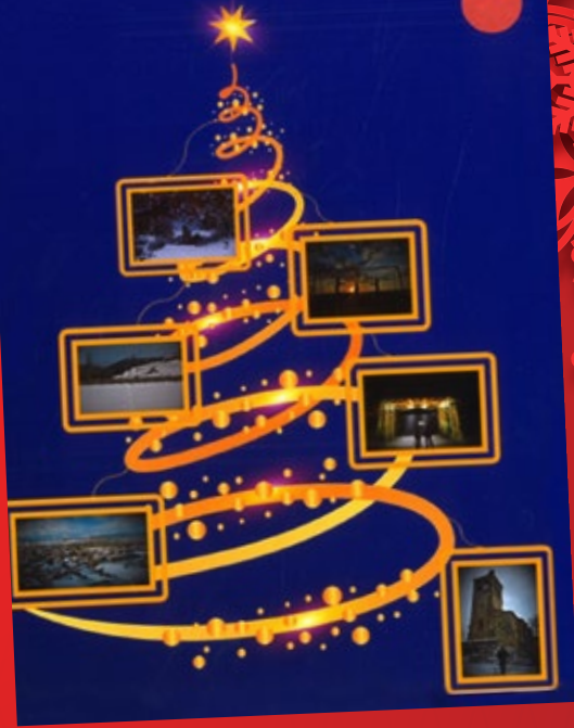
Isabel Camarero Categoría G