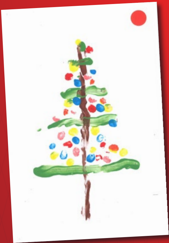
Duengo Vicario Cepa Categoría A